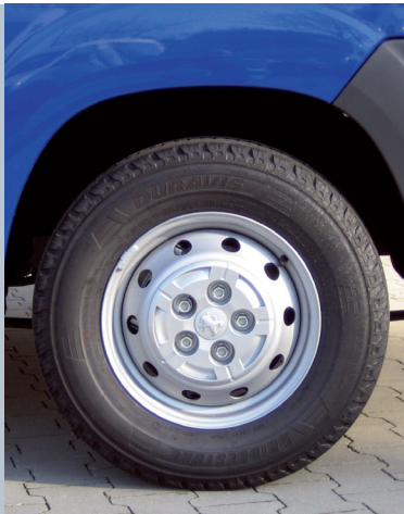
Abfahrbereites Fahrzeug (normale Höhe)