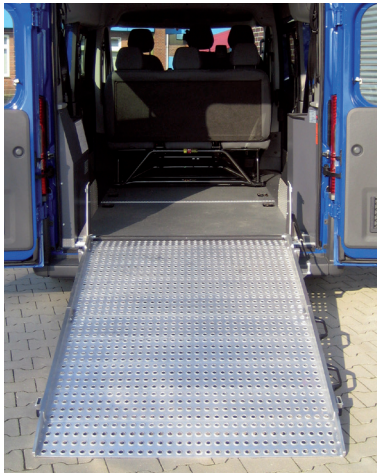
Abgesenktes Fahrzeug zur Aufnahme der Fahrgäste bereit.